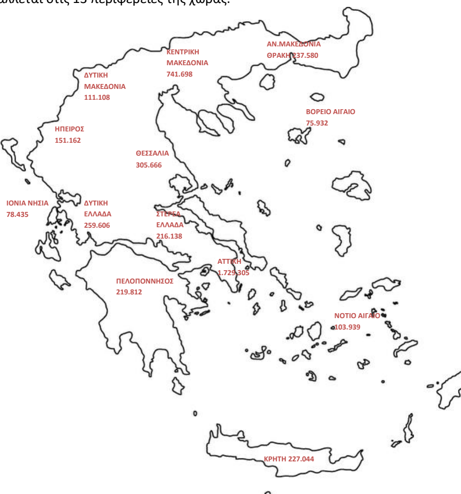
Χάρτης 1: Καταβολή Συντάξεων ανά Περιφέρεια

Για 24.652 εγγραφές δεν υπήρχε ένδειξη ΤΚ και για το λόγο αυτό δεν περιλαμβάνονται στον Πίνακα 7. Στο χάρτη που ακολουθεί αποτυπώνεται ο αριθμός των συντάξεων που καταβάλλεται στις 13 περιφέρειες της χώρας.