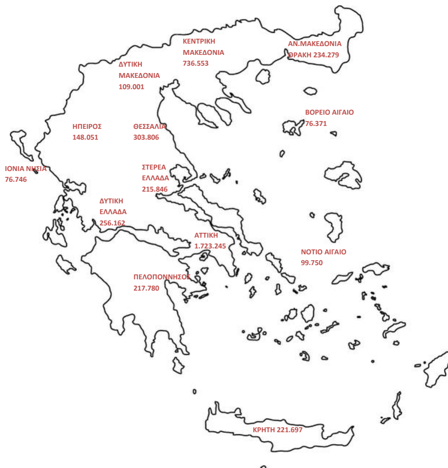
Χάρτης 1: Καταβολή Συντάξεων ανά Περιφέρεια

Για 16.818 εγγραφές δεν υπήρχε ένδειξη ΤΚ και για το λόγο αυτό δεν περιλαμβάνονται στον πίνακα 8. Στο χάρτη που ακολουθεί αποτυπώνεται ο αριθμός των συντάξεων που καταβάλλεται στις 13 περιφέρειες της χώρας.