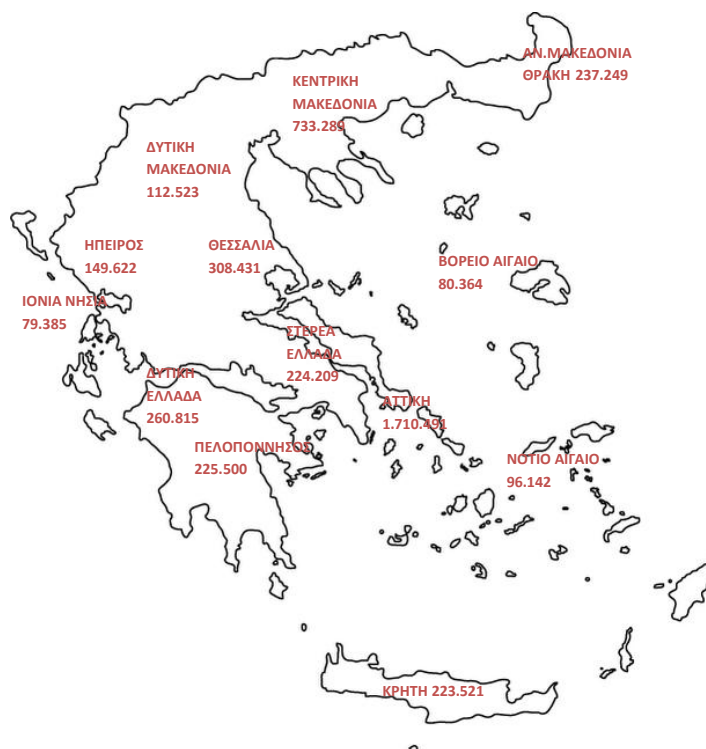
Χάρτης 1: Καταβολή Συντάξεων ανά Περιφέρεια

Στον Πίνακα 9 αποτυπώνονται τα ποσά σύνταξης που αντιστοιχούν σε κάθε Περιφέρεια σε σχέση με το αντίστοιχο ΑΕΠ για το έτος 2010 (προσωρινά στοιχεία ΕΛΣΤΑΤ). Σύμφωνα με τα δεδομένα του Πίνακα 9, στην Περιφέρεια Ηπείρου παρατηρείται η μεγαλύτερη τιμή (17,5%) του λόγου ποσού σύνταξης προς ΑΕΠ και ακολουθεί η Περιφέρεια Θεσσαλίας με τιμή 17,1%. Στην τελευταία θέση βρίσκεται η Περιφέρεια Νοτίου Αιγαίου με τιμή 7,8%.